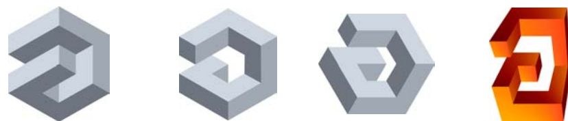
Объёмные, трёхмерные, трёхосевые 3d

Скульптурные трёхмерные буквы для фирменных знаков, для офисных украшений и сувениров – явление крайне редкое. Такие знаки могут иметь твёрдотельные компьютерные версии. Трёхосевые объёмные знаки – собственность автора.